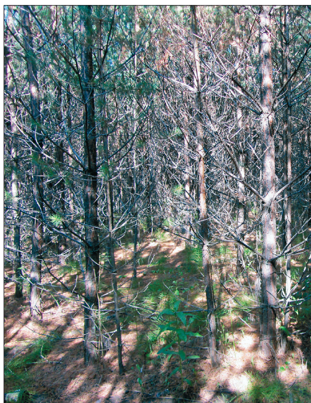
Рис. 2. 14-летний молодняк сосны на ПП 9 в 2014 г.

В 2007 г. густота молодняка составляла 17 167 деревьев на 1 га (табл. 2). В 2008 и 2009 гг. в связи с вращанием новых деревьев, достигших высоты 1.3 м, отмечено увеличение количества деревьев на единицу площади. Максимальная густота деревьев на ПП зарегистрирована в 2009 г. в 8-летнем возрасте молодняка (более 18 тыс. на 1 га). В последующие годы