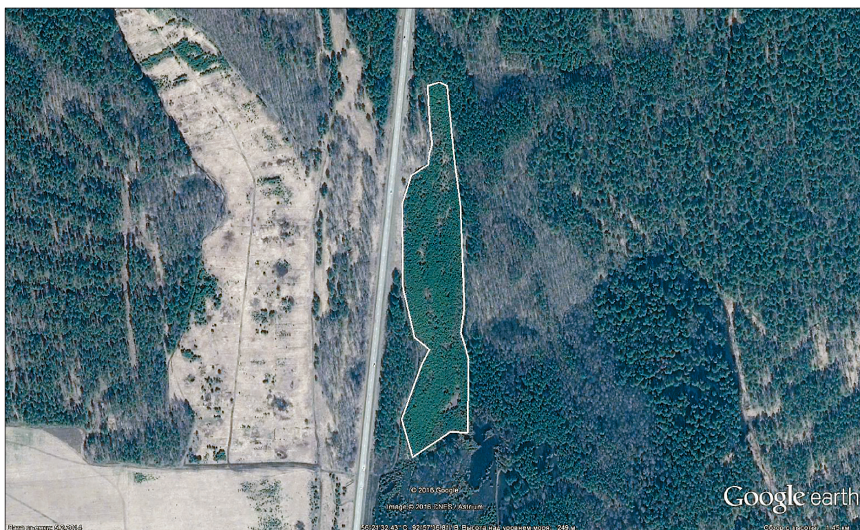
Рис. 1. Выдел молодняка сосны естественного формирования площадью 4.38 га, возникший на заброшенной пашне после низового пожара 1999 г. (Google Earth, 2016).

В наших исследованиях данный молодняк служит началом естественного ряда роста и